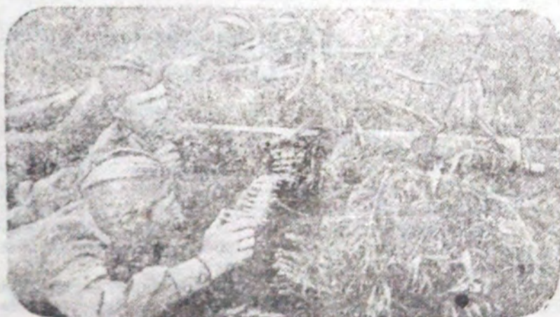
НА СНИМКЕ: Расчёт станкового пулемёта на огневой позиции.